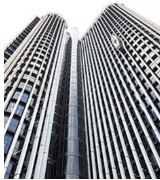
‘Torre Europa’, de Infinsa, en la zona de Azca (Madrid).

Aunque las grúas para oficinas todavía no han llegado a Valdebebas, sí que lo han hecho en otros puntos de la Capital, con proyectos de un volumen importante y de altísima calidad, como son Torre Chamartín de Merlin, que proyecta un rascacielos de más de 100 metros de altura con 14.000 metros cuadrados de oficinas o el proyecto de Gmp en las Las Tablas, bautizado como Oxexo , con otros 14.000 metros cuadrados. Asimismo, está el proyecto de Insur en Madrid Río, con 26.000 metros cuadrados, o el de Julián Camarillo, 29-31, de Torre Rioja , el más grande de todos, con 40.000 metros cuadrados. Por otro lado, destaca el caso de Colonial, que adquirió dos inmuebles en el centro de Madrid para su rehabilitación, pero pueden considerarse obra nueva, ya que el proyecto comprende la demolición del edificio actual para levantar uno totalmente nuevo. Concretamente, se trata de Discovery Building , un inmueble de 10.000 metros cuadrados en Estébanez Calderón, 3-5, y de Príncipe de Vergara, 112, de 11.000 metros cuadrados.