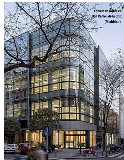
Edificio de Axiare en Don Ramón de la Cruz (Madrid). EE