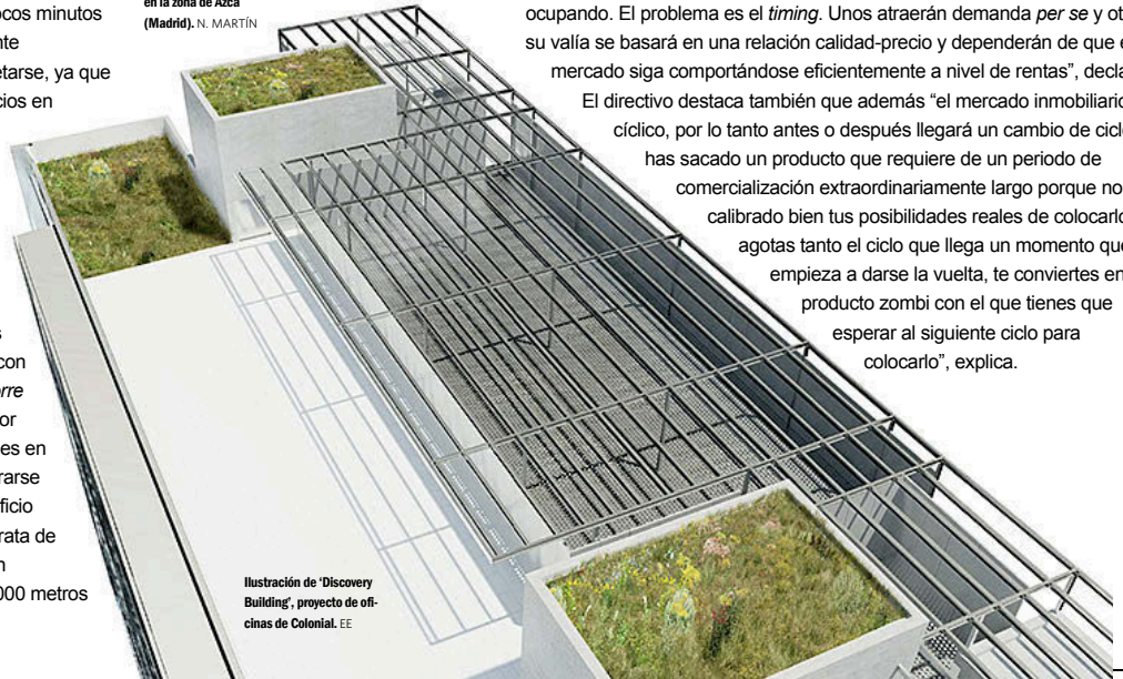
Ilustración de ‘Discovery Building’, proyecto de oficinas de Colonial. EE

La falta de producto de calidad y la buena evolución de los fundamentales económicos son, según Ilan Dalva, de BNP RE, los motivos que han animado a las promotoras a desarrollar oficinas de nuevo. “El tope de absorción en el mercado de oficinas llegó en el año 2007, con casi 1 millón de metros cuadrados. En 2013, alcanzamos el nivel más bajo -300.000 metros cuadrados-. En ese escenario, era inviable que ningún promotor sacara ningún proyecto adelante. 2014 fue el año del inicio de la recuperación de la economía y lo poco que se logró absorber hasta ese momento fue producto de alta calidad, por lo que ahora hay una carencia de ese tipo de producto”, explica el directivo.