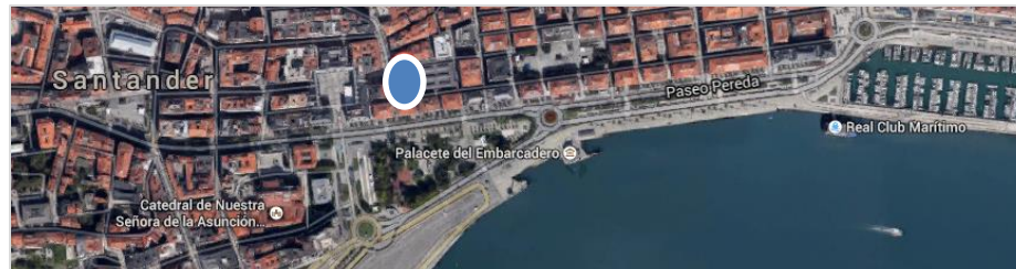
EDIFICIO ATAULFO ARGENTA, 5 Santander